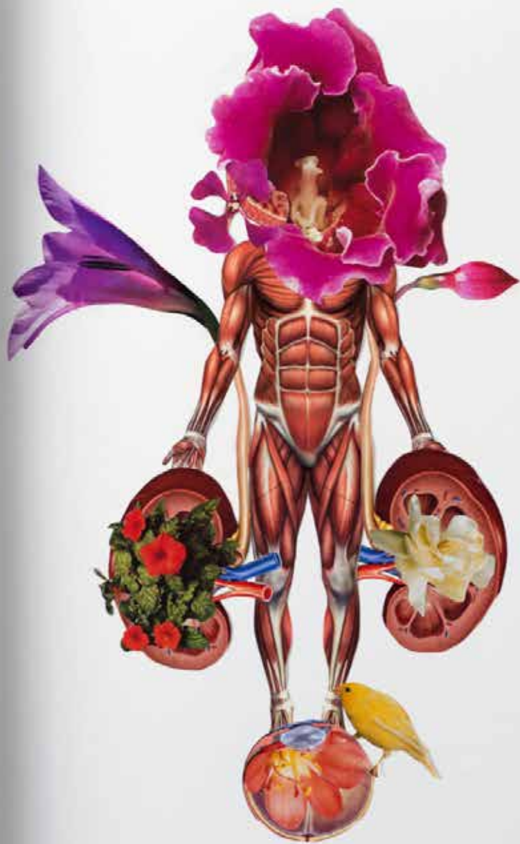
Un'immagine del "Sistema degli spiriti di Galeno" di Silvio Giordano